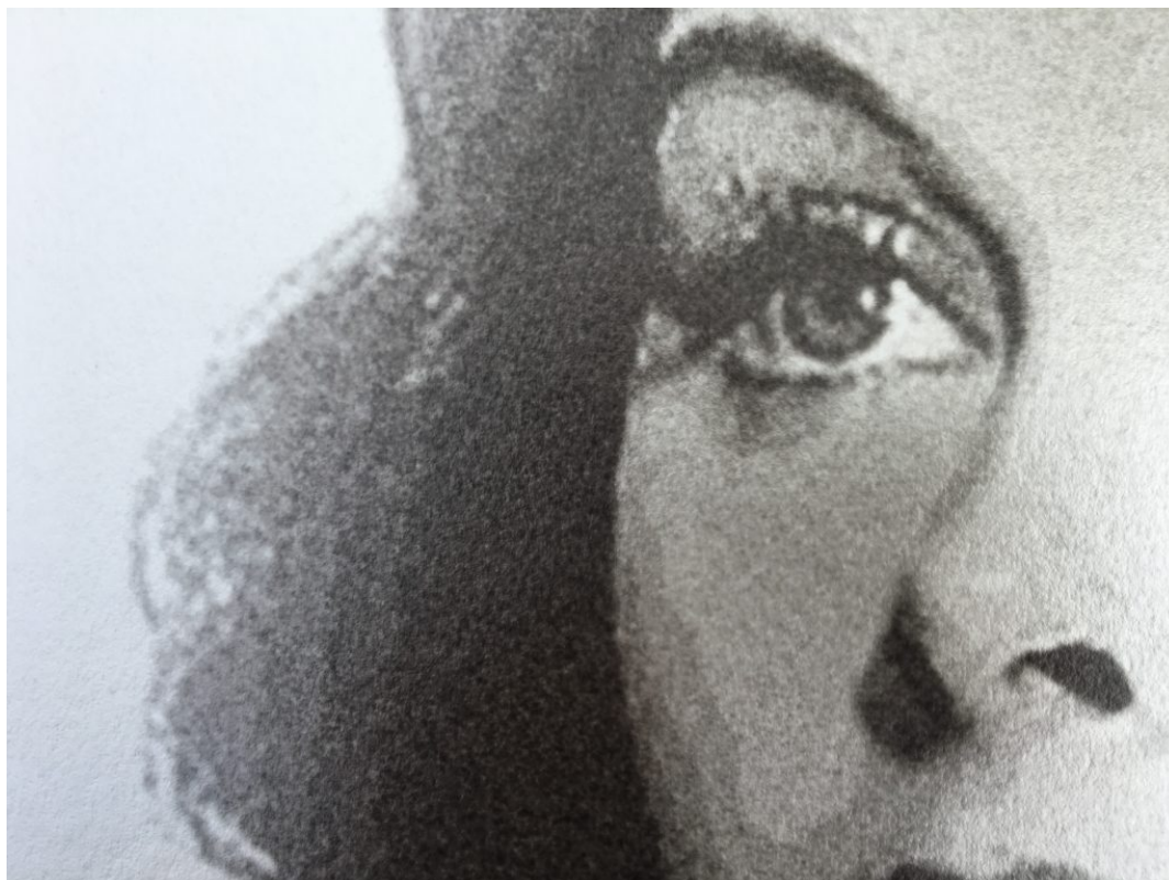
Zoom sur un test de tirage en technique d'impression piezométrique sur papier Hahnemuhle métallisé.

Pour voir les autres photos de la série : http://www.christiandelecluse.com/projet/les-fantomes-de-la-machine/