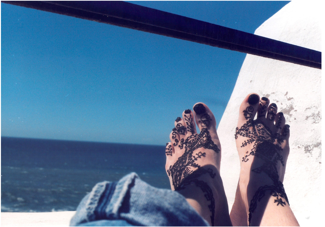
Deux pieds , Essaouira, 1999. (Ci-dessus: Deux oranges , idem.)